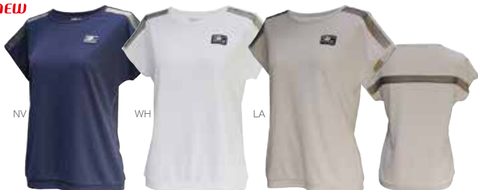
ラメチュールレースを切り替えたゲームシャツ。裾の切り替えがポイント。