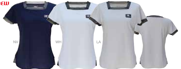
ラメチュールレースを使ったスクエアネックゲームシャツ。裾のレースがポイント。