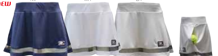
ラメチュールレースを使ったフレアスカート。