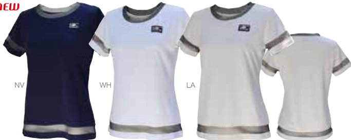
ラメチュールレースを使いで上質感がアップしたゲームシャツ。